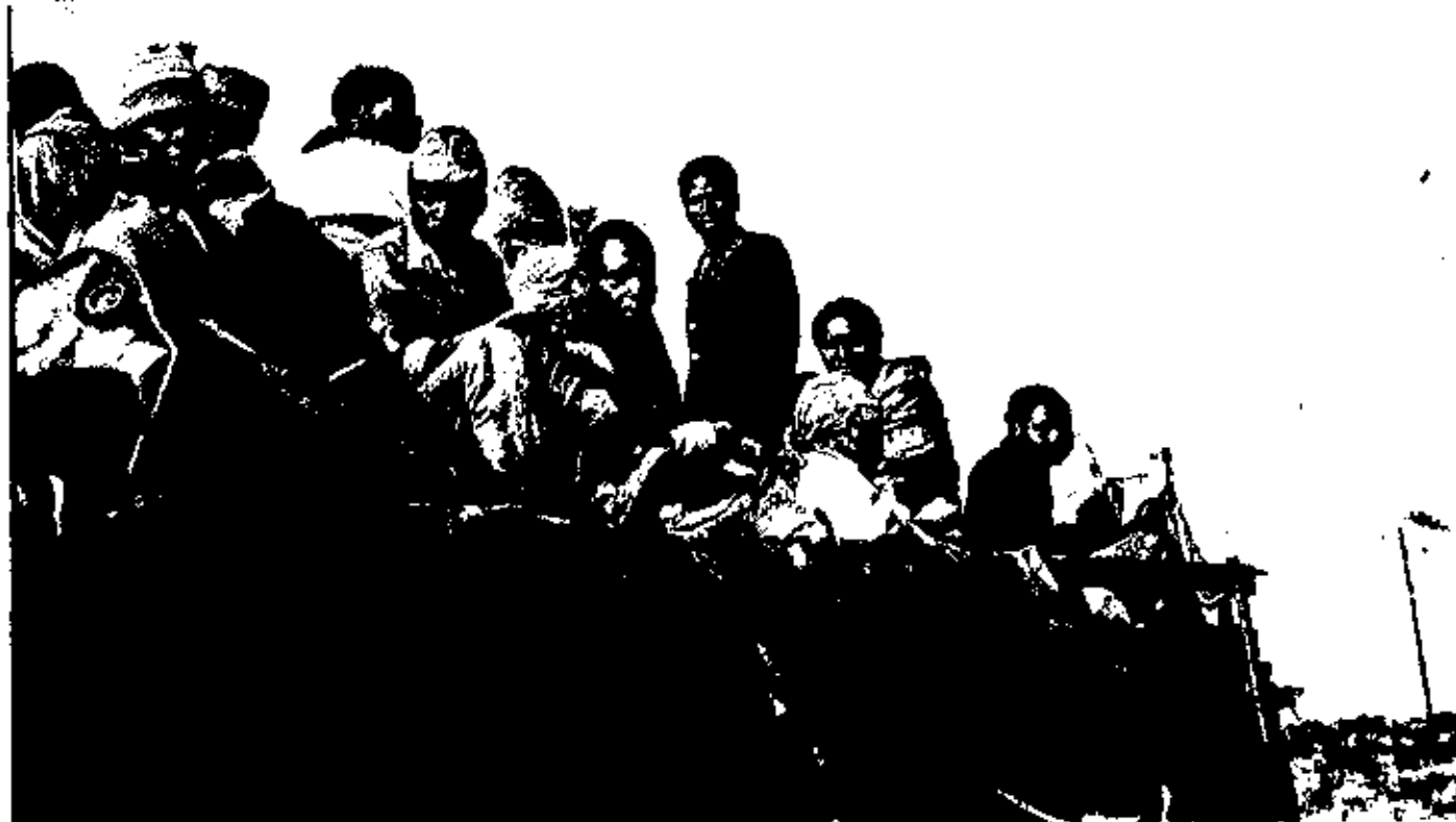
As populações moçambicanas são constantemente deslocadas devido à guerra e à seca

mados a intervir que a décima primeira ronda não teve de ser interrompida, quando o impasse criado pela Renamo — a propósito das actividades da Comissão Mista de Verificação (Comive) dos acordos parciais existentes para os "corredores" da Beira e do Limpopo — estava quase a fazer com que as delegações fossem uma vez mais até Moçambique, aguardar novas instruções.