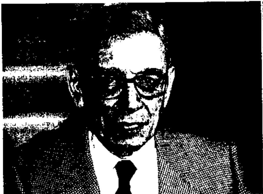
Boutros Boutros Ghali: a scholar and witty bon vivant, but no one's pushover

be the kiss of death," and an American diplomat at the U.N. agreed it would be impolitic for the U.S. to use its big-power muscle: "We weren't going to be the 900-lb. gorilla."