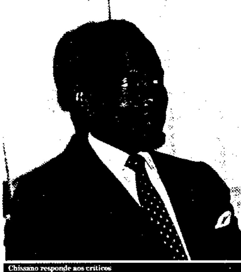
Chissano responde aos críticos

gundo Chissano — que, no entanto, declinou especificar quais os níveis de elasticidade das várias partes envolvidas no processo negocial. As leis em questão são nomeadamente a dos partidos, de imprensa, de liberdade de expressão e do direito de associação e reunião.