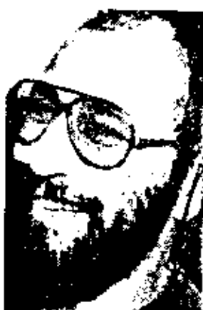
TREVOR MANUEL In a vindictive mood