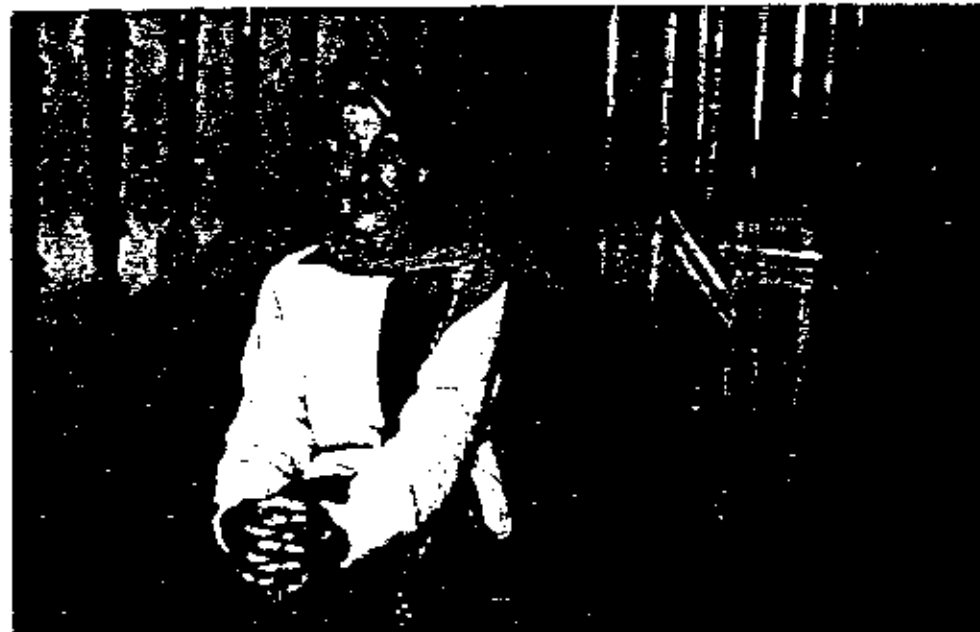
Nadine Gordimer, sul-africana de 67 anos, recebeu o Nobel mais aplaudido dos últimos anos

dine Gordimer não se confunde com os mundos da sua ficção. Por isso, os seus romances, os seus contos, não são panfletos nem exercícios de realismo socialista. Como ela afirma, não é todavía possível traçar uma linha divisória absoluta entre eles: o que os une é a impossibilidade de viver plenamente a condição humana na situação de «apartheid». O meio que usa para revelar esse «defeito» de humanidade é o diálogo. Sabe, de uma forma ímpar, embalar-nos numa descrição, seja da Natureza africana, seja, mais frequentemente, das pequenas situações do quotidiano, um encontro a dois ou uma festa. Os objectos, os estados de alma, sucedem-se, entrelaçam-se, conduzem-nos no prazer duma leitura fácil, ao fio do seu estilo corredo. De repente, irrompe uma frase ou um curto diálogo, e toda a esquizofrenia latente explode em cima do