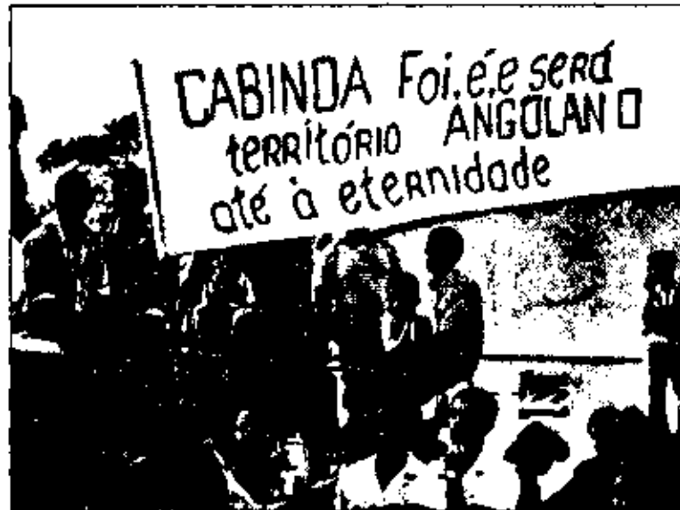
Um enclave problemático Luanda prepara-se para aliviar a pressão

Savimbi prossegue, entretanto, a sua visita aos Estados Unidos, apostado em demonstrar