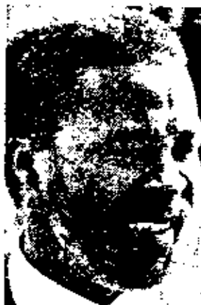
THABO MBEKI Made firms feel wanted

Offending firms that have resisted pressure to leave is one thing. But in attacking the Sullivan Code, the ANC team did nothing to reassure the representatives of companies that have departed. Scouts from General Motors and Ford were on