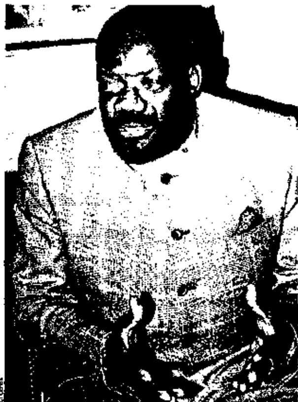
Jonas Savimbi: a UNITA vai exigir a criação de uma comissão de reavaliação das potencialidades de cada investimento e do modo como foram concretizadas as respectivas negociações

— o que leva à necessidade de uma grande ponderação no momento da decisão de concretizar um investimento —, o mercado angolano pode constituir a «primeira porta para a desejável internacionalização da actividade das pequenas e médias empresas portuguesas».