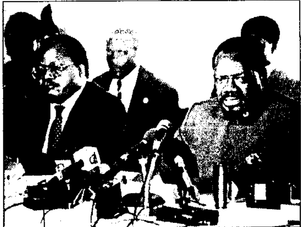
O líder da UNITA, Jonas Savimbi, que ontem iniciou uma visita aos EUA, será recebido amanhã pelo Presidente George Bush

O líder da UNITA, que ontem iniciou uma visita aos EUA, de acordo com fontes que lhe são próximas, poderá apoiar a revogação da lei em causa se receber «garantias» dos empresários americanos