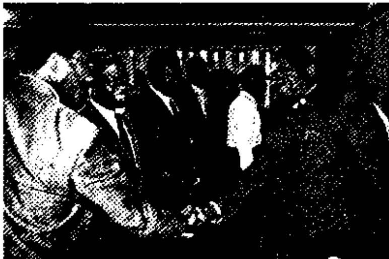
Jonas Savimbi cumprimenta os delegados governamentais da CCPM

Estas declarações de Savimbi, posteriormente repetidas num comício em Luanda, geraram protestos dos outros partidos da oposição, que recusam ser relegados para o "terceiro plano" a que ele os queria votar.