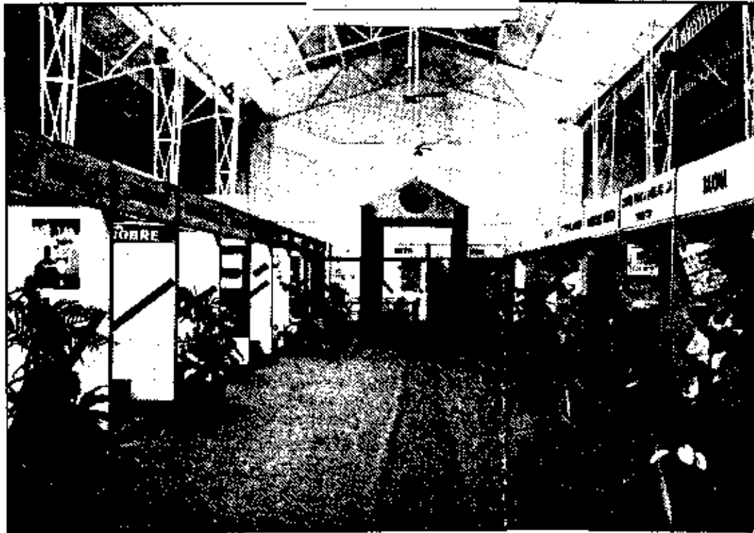
Filda 91: uma presença portuguesa com reforçada esperança

Depois de terem aumentado 12 milhões de contos em 1988, 24 milhões em 1989 e 7 milhões em 1990, as exportações portuguesas para Angola deixaram este ano de crescer. No primeiro semestre ficaram mesmo abaixo do ano passado.