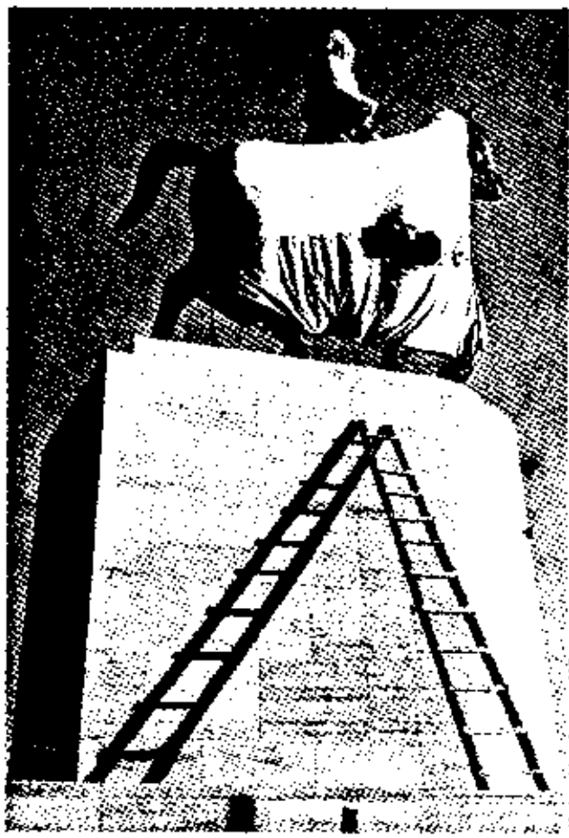
Herbert List, Alameda 1957