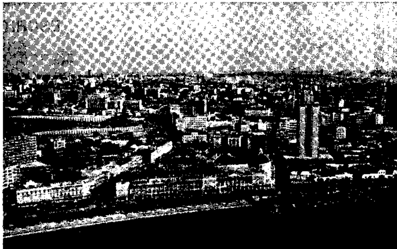
A Esta — Gestão de Hotéis, S.A. passou a gerir, em Setembro, mais duas unidades hoteleiras em Luanda

Resta apenas acrescentar que a Esta foi criada com a intenção de se tornar numa cadeia hoteleira de matriz portuguesa, por forma a dinamizar o sector turístico no países africanos de língua oficial portuguesa, independentemente de também vir a desenvolver actividades em Portugal.