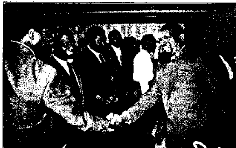
Jonas Savimbi na CCPM O regresso ao diálogo

Nesta sua primeira passagem por Luanda, Savimbi reuniu-se também com a Comissão Conjunta Político-Militar (CCPM), que supervisiona os acordos de paz, à