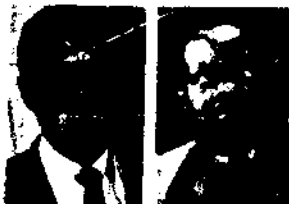
Holden e Savimbi: EUA gastaram 32 milhões